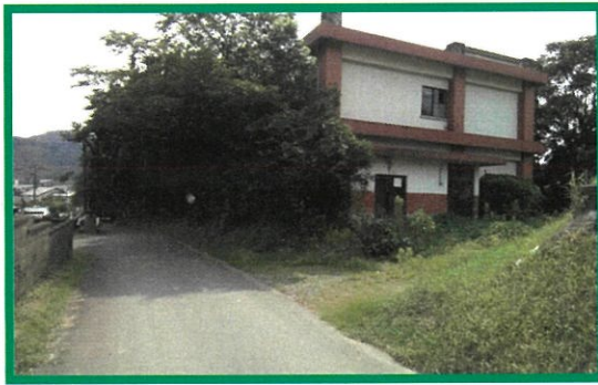
吉松スポーツセンター南側